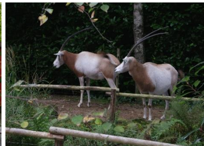
Wat zouden ze denken?