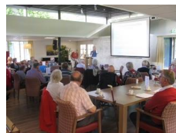
aan veel geïnteresseerden