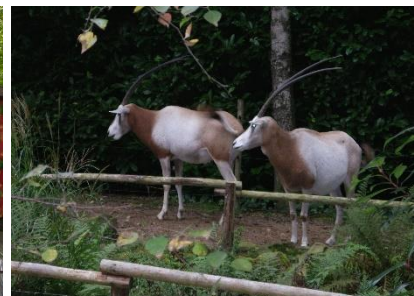
Wat zouden ze denken?