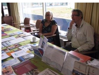
De infotafel lag weer vol met informatie

De presentatie is terug te vinden op onze website www.parkinsoncafelaren.nl . Kies voor archief en zoek onder lezingen.